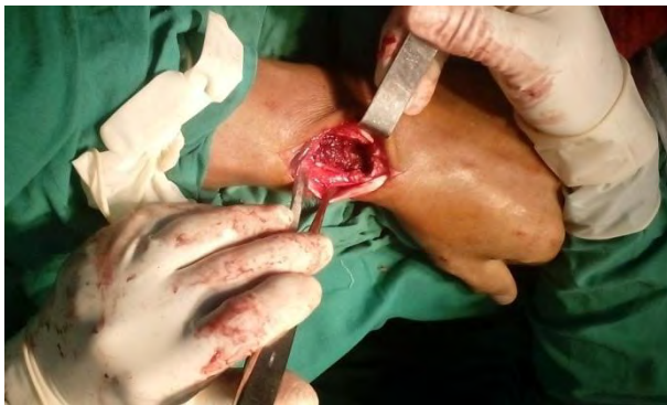
Figura 3. Tumor resecado.