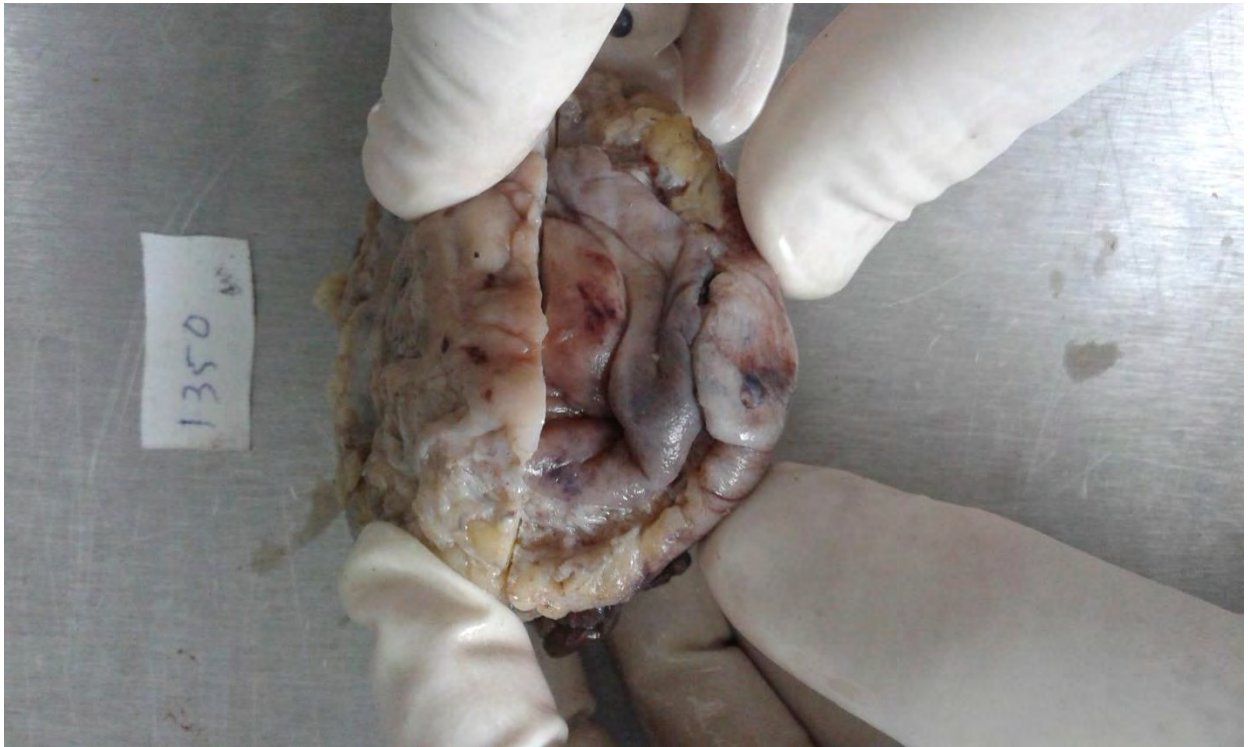
IMAGEN-2. Masa de tejido, de 7x 5x 4 cm, revestida por peritoneo visceral; color pardo-grisáceo; acompañada de tejido adiposo.