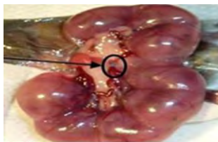
Fig. 2 Ligadura de la arteria derecha en su punto medio, variación en el sitio de ligadura de la arteria uterina.