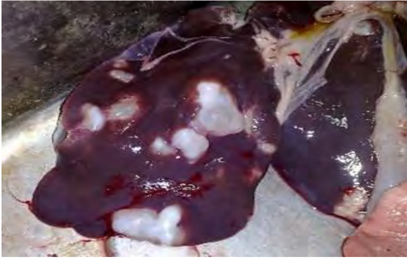
Imagen macroscópica del quiste hidático