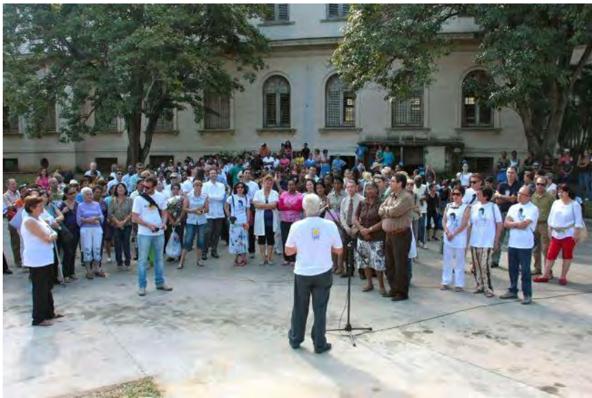
Imágenes del día 9 de marzo del 2013, inauguración del Parque