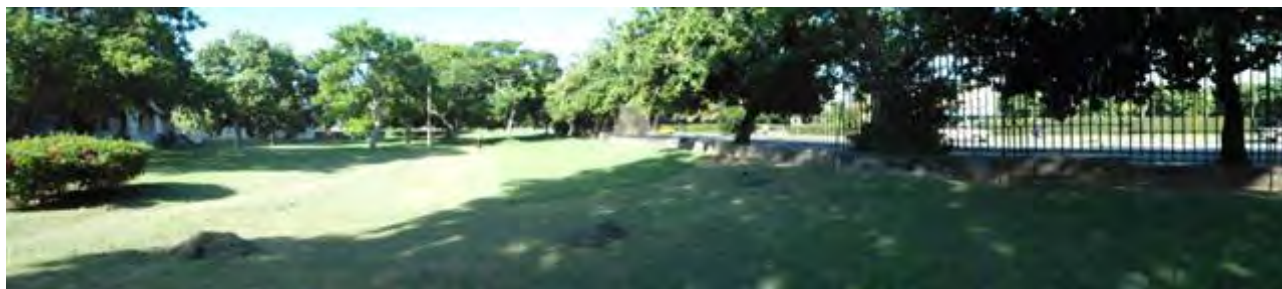
Vista panorámica del área donde se construyó el parque