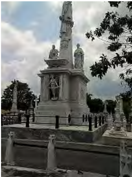
4-Mausoleo a los Estudiantes de Medicina. Necrópolis de Colon.