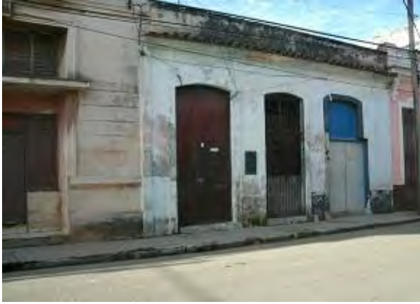
3-Casa en Santiago de las Vegas donde residió Fermín Valdés Domínguez. (1881-83)